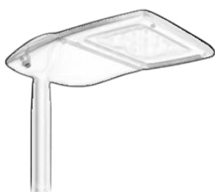
a) Motor. provoz

Příklady možného designového provedení svítidel: