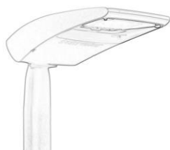
a) Obsl. kom.