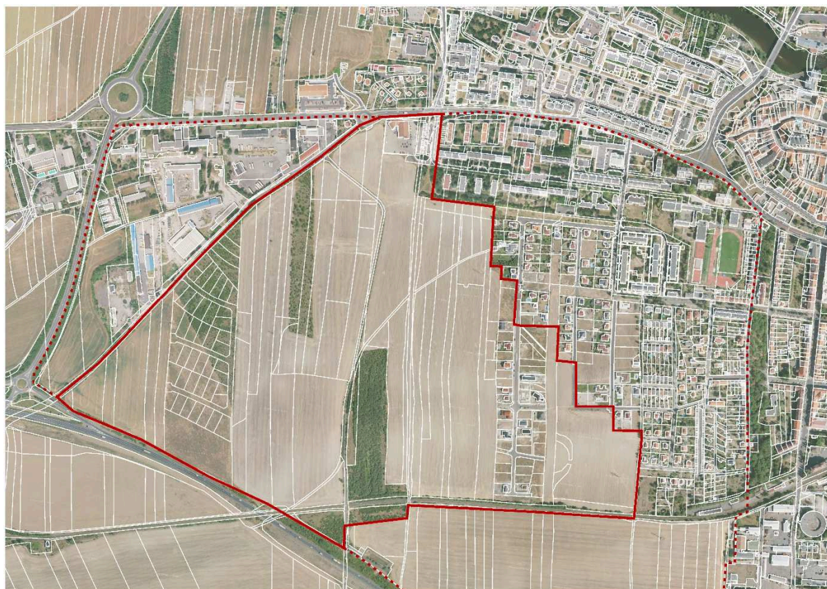
vymezení řešeného území a území širších vtaů